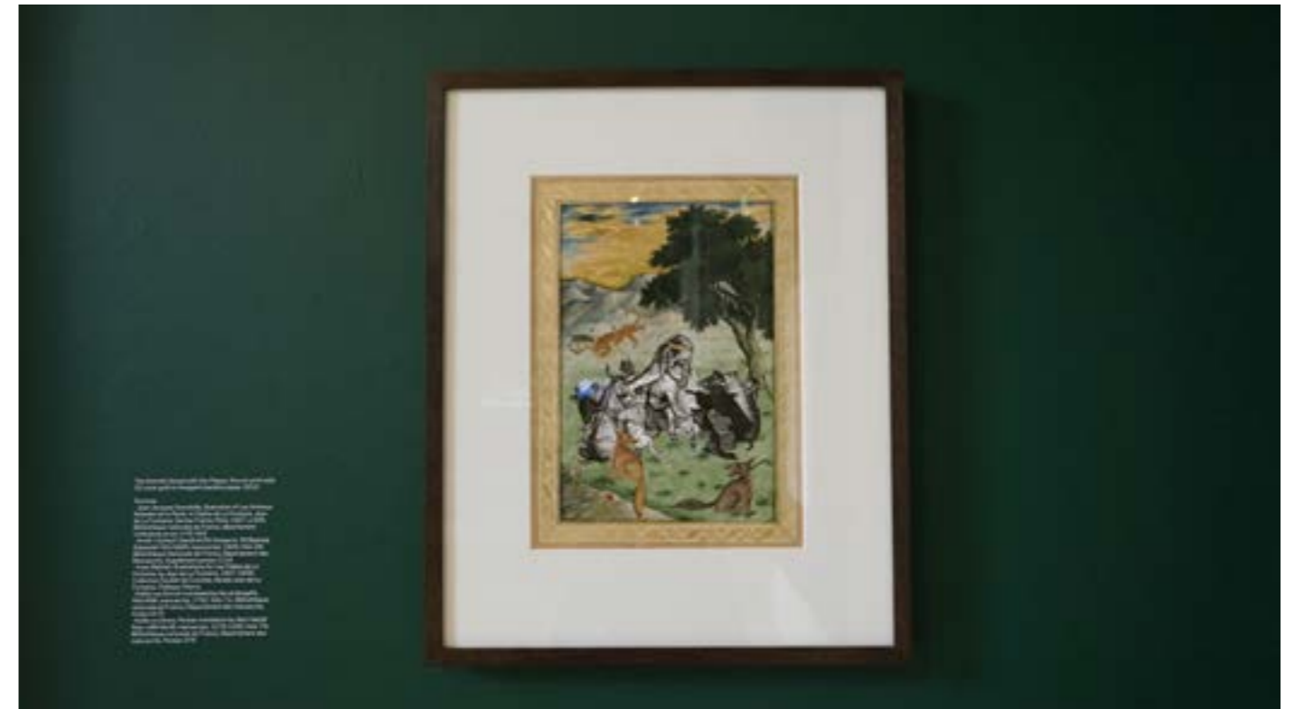
Vues de l'exposition What Language Do You Speak, Stranger? à The Mosaic Rooms, Londres, 2016.