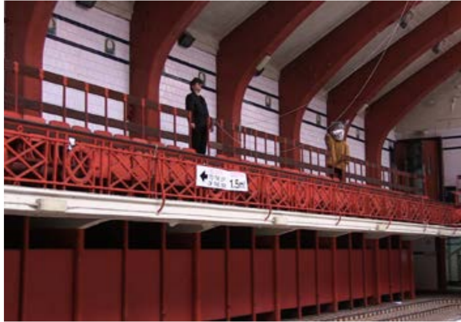
Vues de la performance, Stream of Stories à Govanhill Bath, 2017, Glasgow.