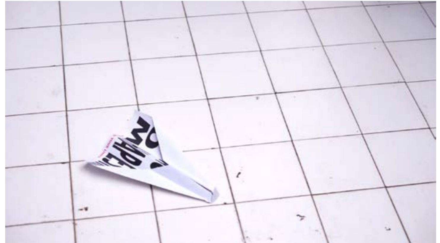
Vues de la performance, Stream of Stories à Govanhill Bath, 2017, Glasgow.