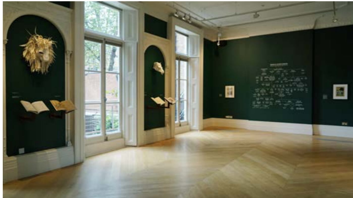
Vue de l'exposition What Language Do You Speak, Stranger? à The Mosaic Rooms, Londres, 2016.