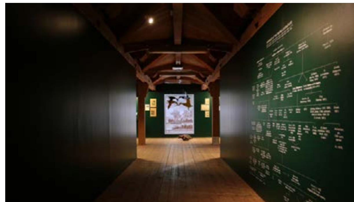
Vue de l'exposition, Entry prohibited to foreigners, HavreMagasinet Länskonsthall, Boden, Suède, 2015