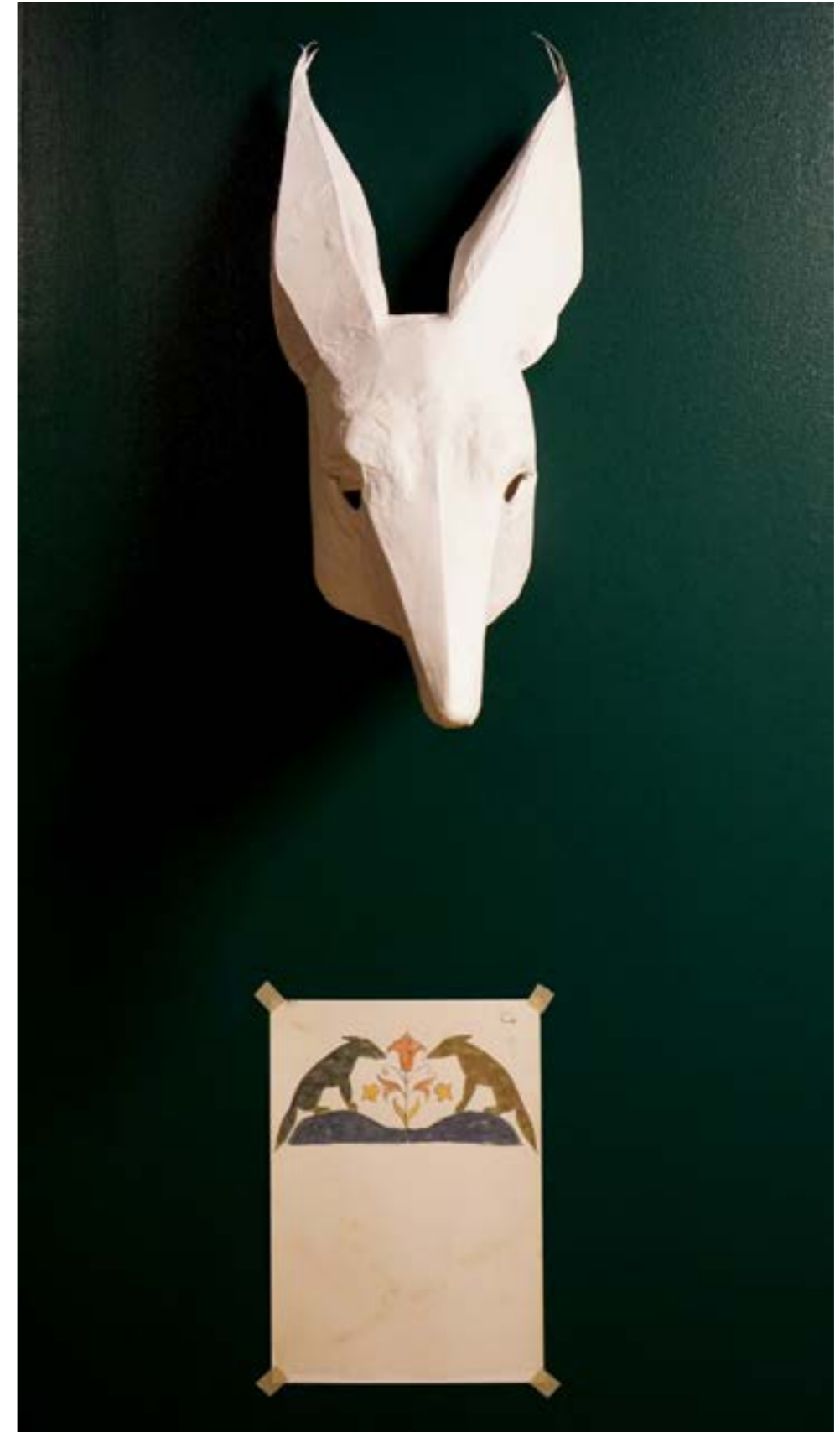
Vue de l'exposition, Entry prohibited to foreigners, HavreMagasinet Länskonsthall, Boden, Suède, 2015.

En réalité, Jean de la Fontaine s'inspira des ouvrages issus des versions perse et arabe et donc déjà modifiés.