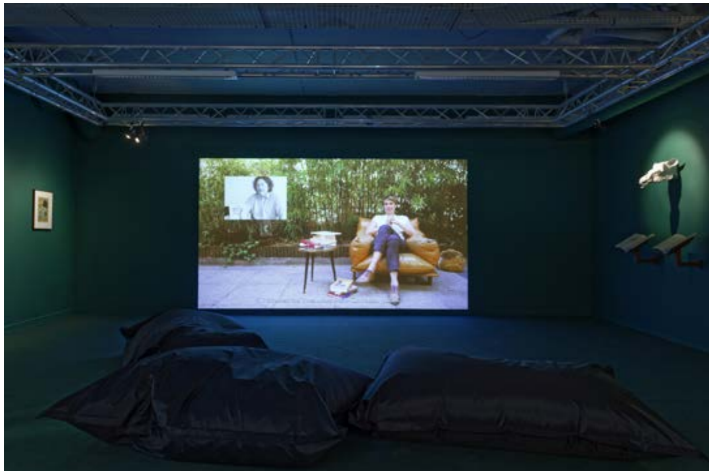
Image extraite de Stream of Stories chap. 5 , Vidéo HD, 34min, 2018.