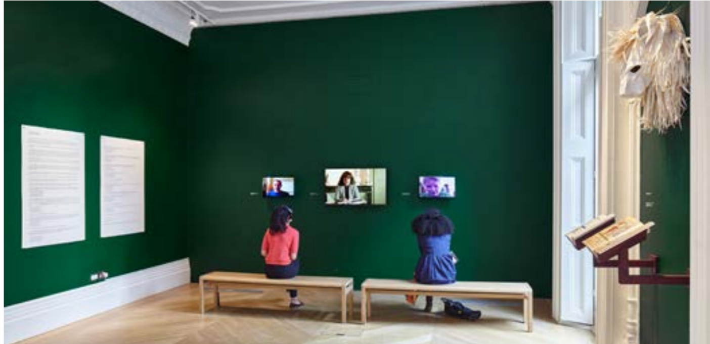
Vues de l'exposition What Language Do You Speak, Stranger? à The Mosaic Rooms, Londres, 2016.