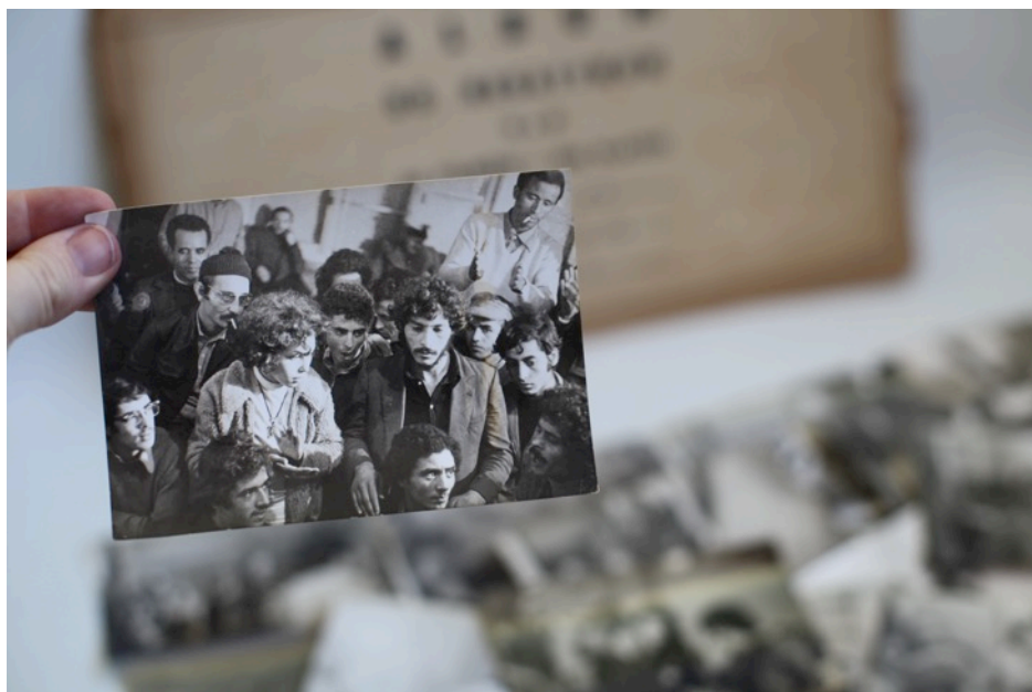
Photographie de tournage du film De quelques événements sans significations , Mostafa Derkaoui, 1974, Archives photographiques de Krimou Derkaoui, ©Léa Morin

Curatrice et chercheuse indépendante, Léa Morin est co-fondatrice et directrice de l'Atelier de l'Observatoire (art et recherche)* à Casablanca. Elle était auparavant programmatrice et directrice de la Cinémathèque de Tanger. Après des études en philosophie et cinéma, elle est diplômée de la filière exploitation de la FEMIS (Ecole Nationale Supérieure des Métiers de l'Image et du Son, Paris).