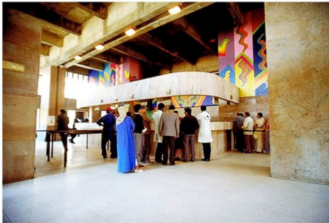
La Poste, bâtiment faisant face à l'appartement de Mostafa Derkaoui, architectes Faraoui et De Mazières, artiste Mohamed Melehi, Casablanca, 1979