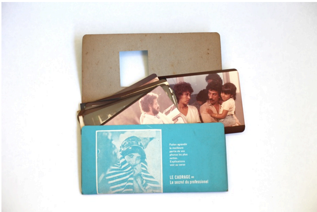
Archives photographiques de Krimou Derkaoui, photographie du tournage du film Titre Provisoire de Mostafa Derkaoui ©Léa Morin