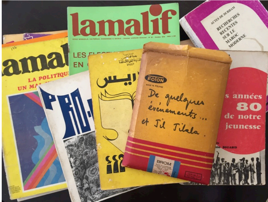
Revue Lamalif, revue Pro-C, ouvrages sur le Maroc et archives photographiques de Krimou Derkaoui

Le projet de recherche « Les invisibles » consiste à retracer à travers des corpus d'œuvres d'art, de films, de photographies, d'essais, de projets architecturaux et urbains, d'expositions, de revues, de documents et archives du Maroc moderne et contemporain, une possible écriture d'histoires (de l'art, du cinéma, de la société, etc) à partir de ce qui n'est pas, ce qui n'a jamais existé, ce qui a disparu ou ce qui est oublié.