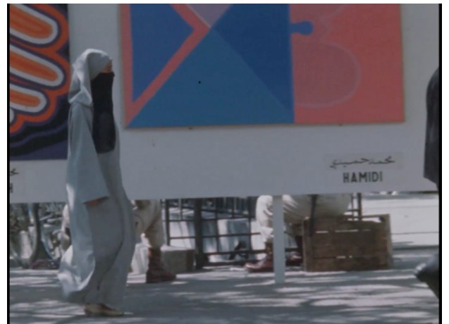
Capture d'écran du film inachevé La Longue Journée de Mohamed Abbazi, tableau de Hamidi, Casablanca, 1969