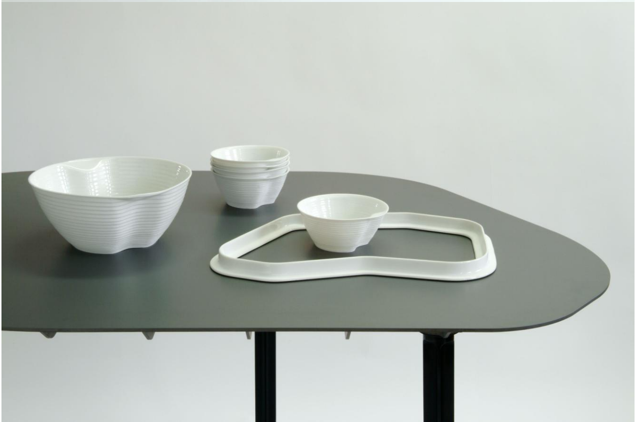
Jean-François Dingjian, Paysage de table , 2005