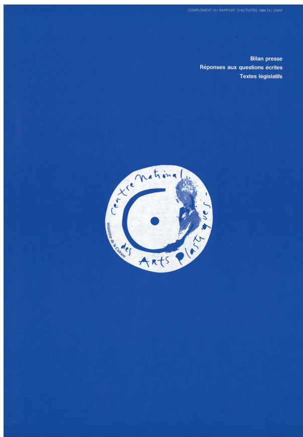
Couverture du complément au Rapport d'activité 1984 du Cnap, Paris : Dap, 1985. Conception graphique : Grapus + Topologies.

Si la politique de relance a posé des bases solides, certaines mesures proposées dans le rapport du groupe de réflexion interministériel attendront le début des années 1990 pour être mises en place, d'autres attendent encore aujourd'hui d'être considérées. Le rapport préconisait, par exemple, la création d'un poste de « délégué à la communication visuelle qui aurait pour mission d'inciter toutes les administrations de France à transformer leur image de marque en liaison avec les meilleurs professionnels 17 ». En l'absence de la création d'un tel poste 18 , Margo Rouard, chargée de