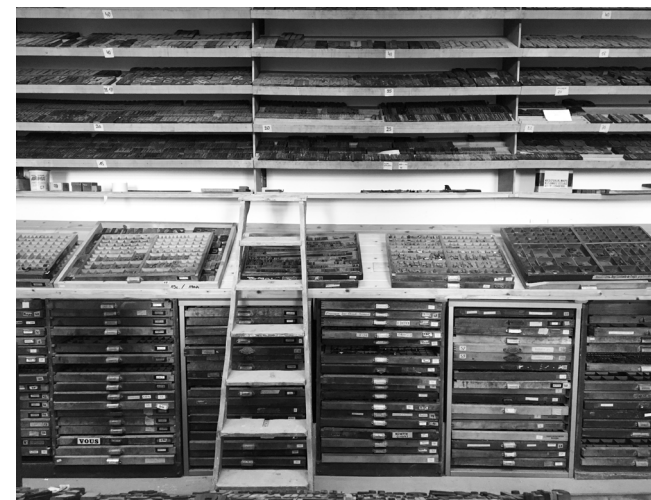
Imprimerie typographique, espace de composition