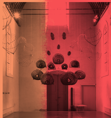
MAT Ancenis-Saint-Géréon - Chapelle des Ursulines, vue de l'exposition Qui Vive ?

Le MAT, centre d'art contemporain du Pays d'Ancenis soutient les artistes par l'organisation de résidences, la production d'œuvres et d'expositions tout au long de l'année au sein de l'ancien presbytère de Montrelais et plus largement sur le territoire du Pays d'Ancenis. À égale distance de Nantes et Angers, la programmation du MAT est liée par un élément naturel remarquable : la Loire. L'équipage du MAT (Montrelais Art Territoire), composé de bénévoles et de salariés, s'engage pour rendre l'art accessible au plus grand nombre à travers des moments de convivialité tels que des rencontres avec les artistes, des visites, des ateliers de pratique artistique, des conférences et des stages.