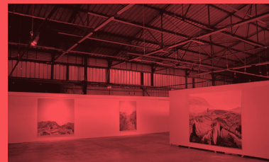
La Friche-La Réunion-«Expo C. Prime».

Ancien centre de tri de la poste qui desservait les villes du Port et de La Possession à la Réunion, la Friche est un centre d'arts visuels soutenu par la ville du Port et dirigé par l'association Village Titan depuis 2019. Le projet de la Friche s'articule autour de trois axes complémentaires : création, diffusion et médiation. Des résidences de création de 2 à 4 mois et des ateliers sont proposés aux artistes, ainsi qu'un espace d'exposition dédié pouvant s'étendre de 200 à 600 m 2 . Des bourses pour les jeunes diplômés et des budgets de production et de promotion accordés par la Friche permettent d'accompagner chaque projet. Pour mobiliser un public large et pluriel, la programmation de la Friche s'attache à proposer des restitutions de la scène musicale ou de la danse qui entrent en résonance avec les propositions plastiques des artistes exposés. Cette porosité entre les disciplines offre un espace de rencontre dans lequel la transdisciplinarité est un champ d'investigation ouvert, permettant de populariser l'art contemporain.