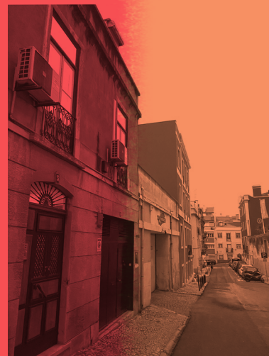
Ampersand (vue extérieure).