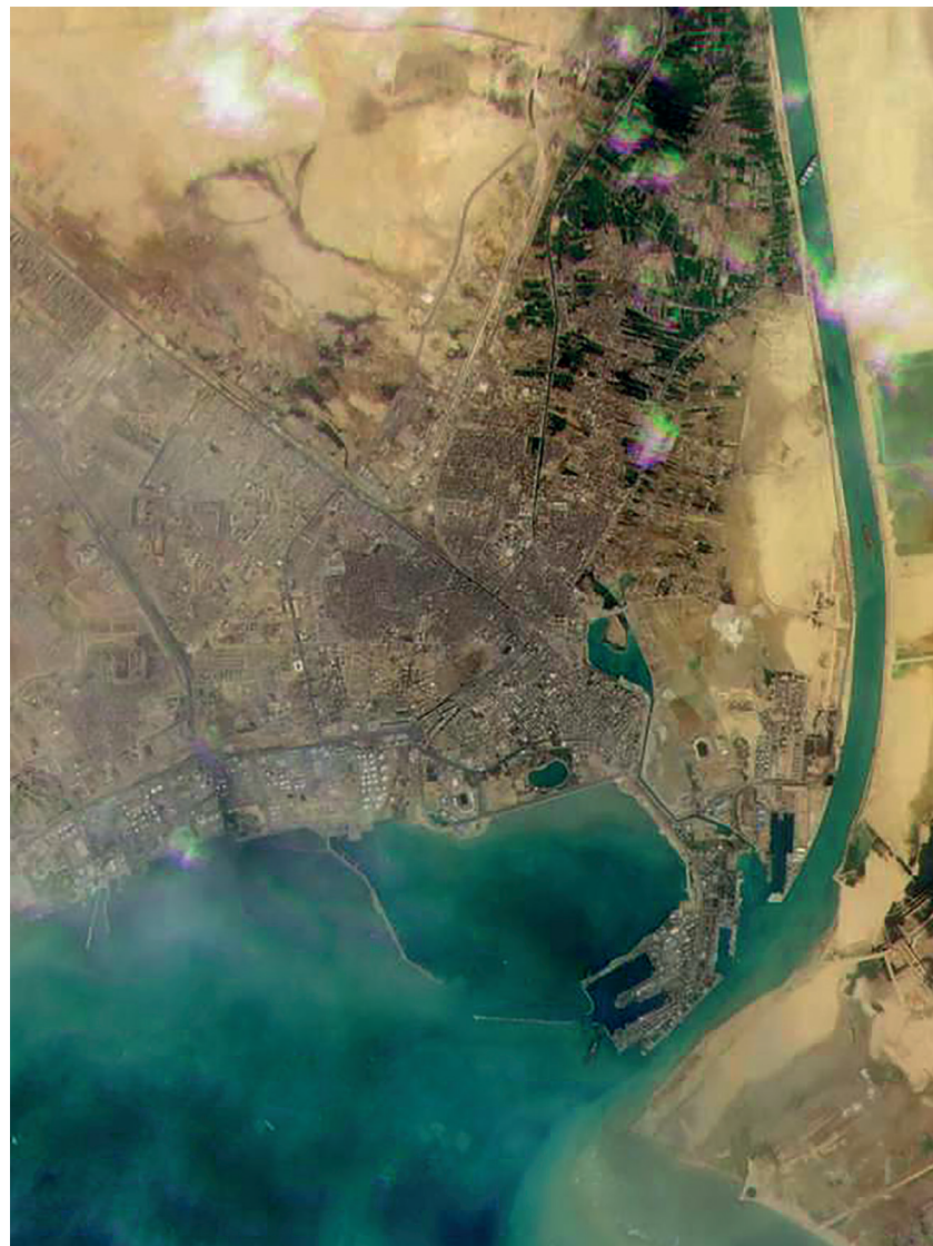
RYBN.ORG, images satellite du porte-conteneurs échoué en travers du canal de Suez, Égypte, 2021. Planet Labs Inc.1