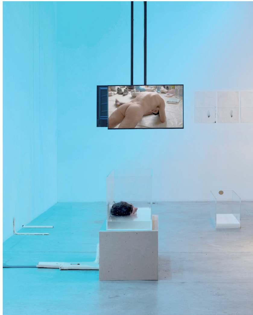
Jean-Charles de Quillacq, The Smell of Work , 2021; installation view in I don't know you like that: The Bodywork of Hospitality , Bemis Center for Contemporary Arts, 2021; Courtesy of the artist and Marcelle Alix, Paris. Photo: Colin Conces.