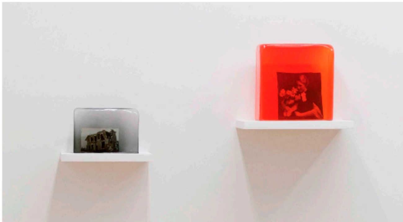
Agnès Geoffroy, Les Captives (ruine + femme fleur), 2020, photographies anonymes, verre soufflé, 15 x 22 x 8 cm + 28 x 28 x 12 cm, Collection FRAC Auvergne, achat à la galerie Maubert, Paris.

« Les artistes-auteurs ont été très nombreux à répondre à cette enquête. Leurs retours nous aident à penser des mesures d'urgence pour les soutenir ainsi que tous les indépendants, commissaires d'expositions, critiques d'art, conservateurs-restaurateurs, monteurs, médiateurs qui sont les premières victimes de cette crise, expliquait Pascal Neveux, président du Cipac et directeur du FRAC Provence-Alpes-Côte d'Azur dans notre édition du 3 avril. Combien survivront si nous ne prenons pas des mesures pour les soutenir en maintenant nos politiques d'acquisition ? »