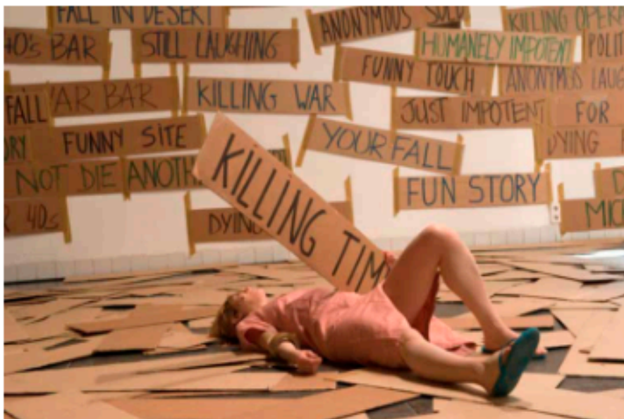
La Ribot, Laughing Hole, 2006, FNAC 2016-0232, Centre national des arts plastiques.

« La culture a un rôle à part. [...] Les lieux de création doivent revivre, les artistes recréer », a déclaré hier Emmanuel Macron après deux heures de vidéoconférence avec différents artistes. « Le 11 mai, les musées, les galeries d'art, les librairies doivent pouvoir rouvrir », a-t-il dit.