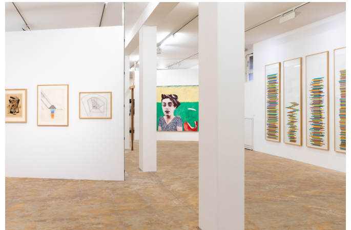
Vue de l'exposition Aller voir et laisser passer célébrant les quarante ans de la Galerie municipale Jean-Collet