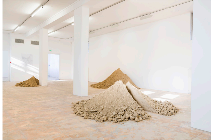
Vue de l'exposition LCCH#2 La matière du monde avec l'oeuvre de Julia Gault