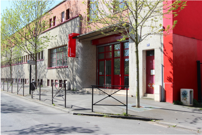
Vue de la façade extérieure de la Galerie municipale Jean-Collet