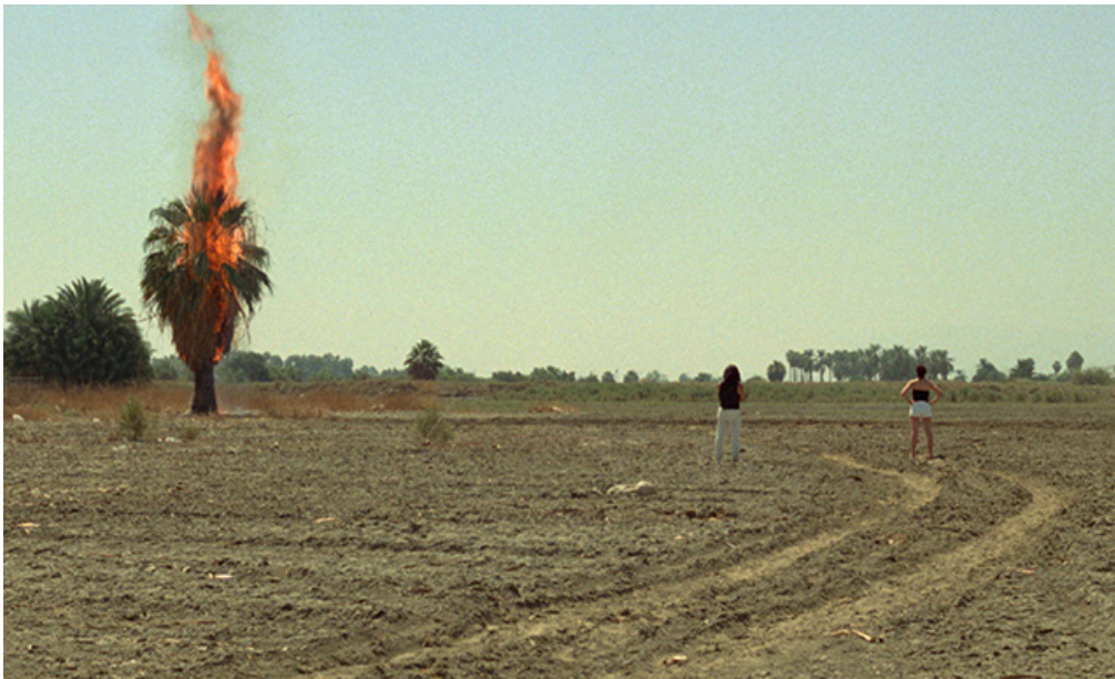
© Nina Menkes, photogramme du film Queen of Diamonds , 1991

L'équipe de Bétonsalon — Centre d'art et de recherche