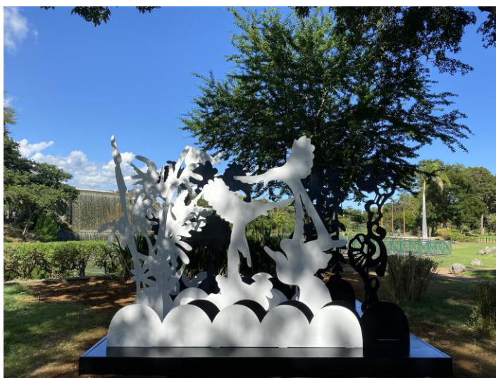
Plateau du Ciel de Chourouk Hriech, Le Port (La Réunion)

« Plateau du Ciel » de Chourouk Hriech, est inaugurée le 31 mai 2023 dans le Parc Boisé de la Ville de Le Port, à La Réunion