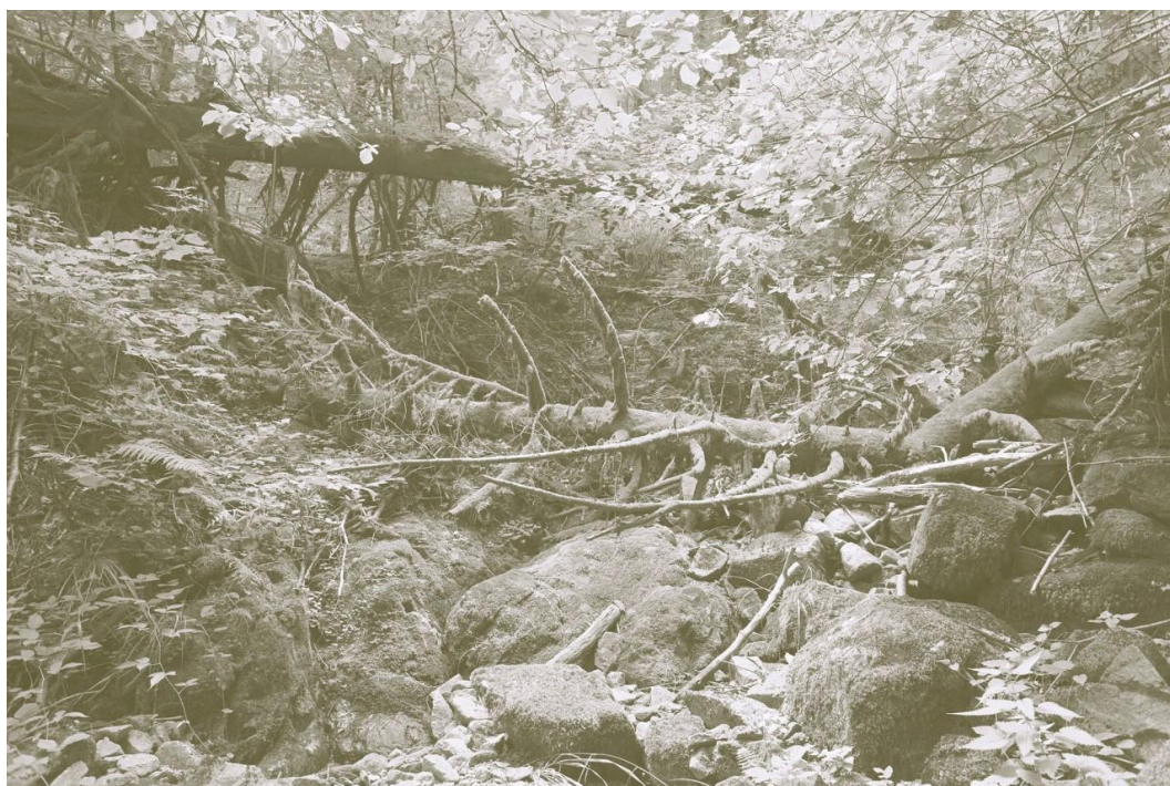
Léa Habourdin, Images-forêts : des mondes en extension , 2021

En savoir plus : www.rencontres-arles.com/fr/expositions/