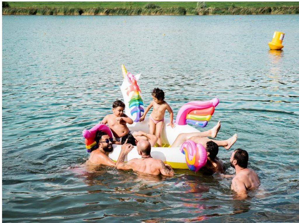
Lucie Jean, Cité lacustre #7, 2021

En savoir plus : www.cnap.fr/exposition-regards-du-grand-paris