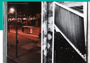
ROMEU SILVEIRA Brazil – Visual arts Discover the art work