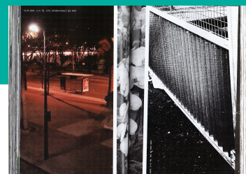
ROMEU SILVEIRA Brésil – Arts visuels Découvrir l'œuvre