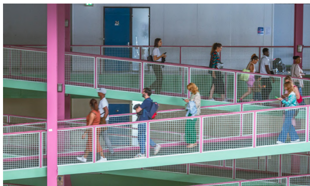
Visuel en couverture : Photo © Clémence Rivalier

Attaché à accueillir et à porter le développement d’idées et de pratiques artistiques et culturelles nouvelles et plurielles, les activités du lieu sont en partie conçues en dialogue avec son équipe, ses usager·ères, les structures associées au lieu issues des champs socio-éducatifs et culturels, et les habitant·es de Pantin et de la Seine-Saint-Denis.