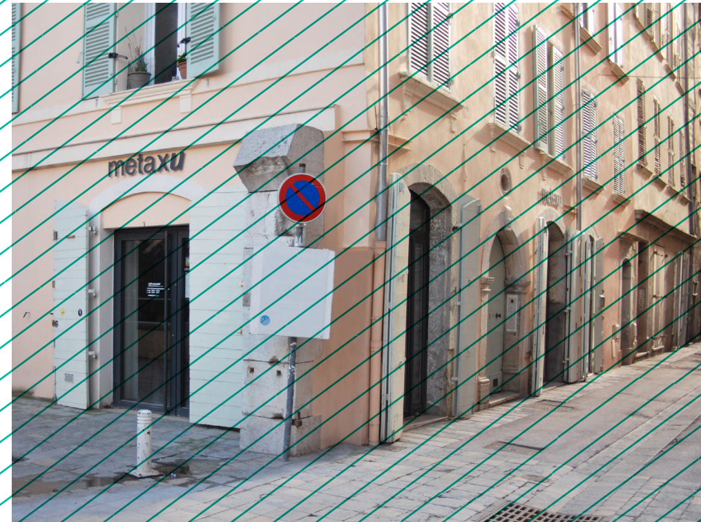
metaxu au coeur du centre historique de Toulon

Cet appel à candidature est ouvert à tous les jeunes artistes de la région du Var, sans restriction d'âge ou de nationalité. Tous les domaines d'expression artistique sont acceptés.