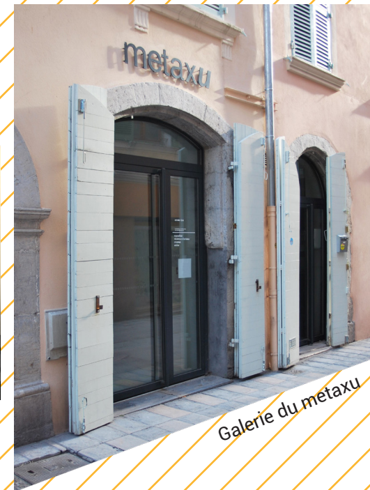
Galerie du metaxu