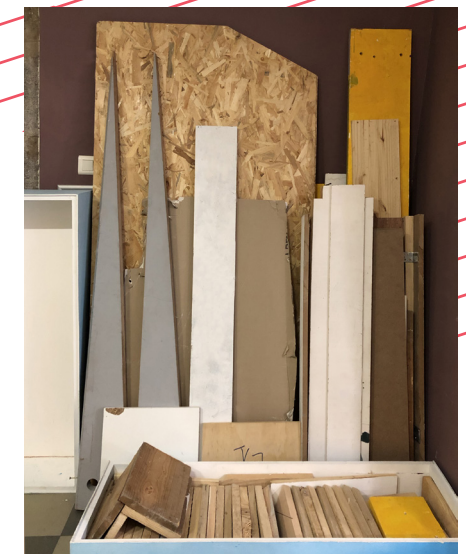
L'Atelier du metaxu