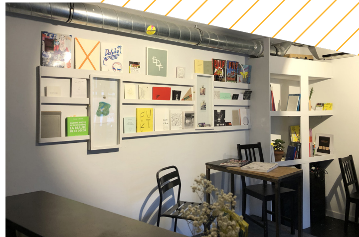
Bibliothèque dans le Café Associatif du metaxu