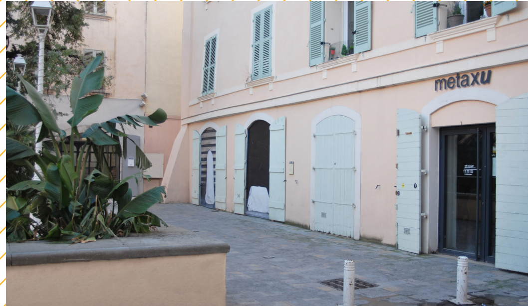
metaxu sur la Place du Globe

Le metaxu est un artist-run space : lieu géré par et pour les artistes. Implanté au coeur de Toulon, le metaxu propose dans sa Galerie un programme annuel de sept expositions / résidences (monographies ou collectifs) et dans son Atelier, des résidences orientées vers la jeune création.