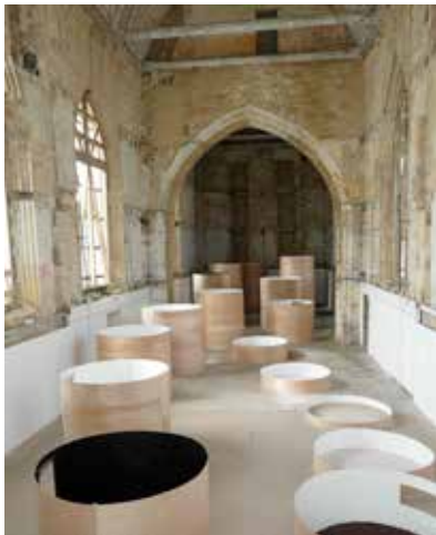
EXPOSITION IN DOOR - 2009