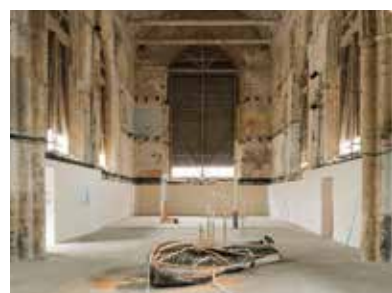
WHEREVER RIVER - 2021 de Maxime Bagni