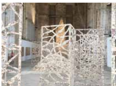
SOUS-BOIS - 2018 de Ladislav Combeuil