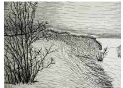
SAUVAGE ORDINAIRE - 2016 de Nastasja Duthois