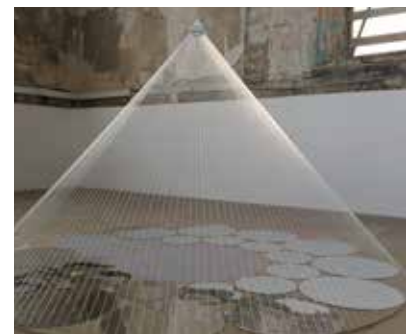
LIEU DE RÉFLEXION - 2017 de Prisca Cosnier