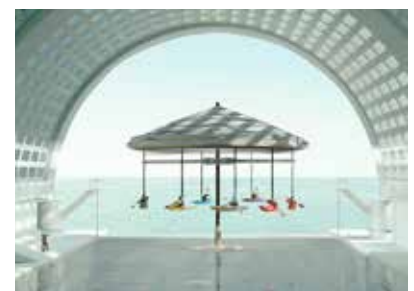
FAIR PLAY - 2022 Muriel Bordier