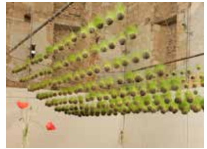
NOCES D'HERBES - 2012 de Gaël Gicquiaud