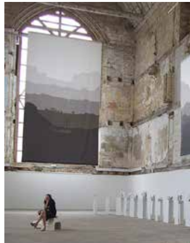
DES VUES - 2015 de Mathilde Seguin