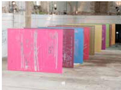
LES PETITS RIENS - 2011 de Bénédicte Klène