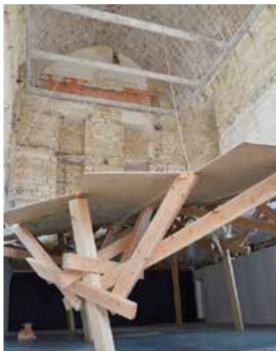
(CH)ARPENTEUR - 2014 de Cantito