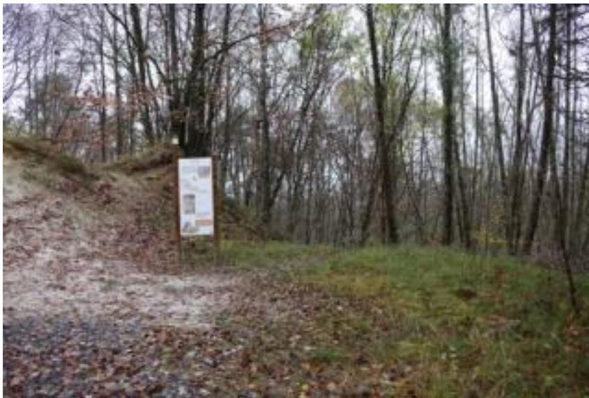
A proximité du panneau sur la lignite