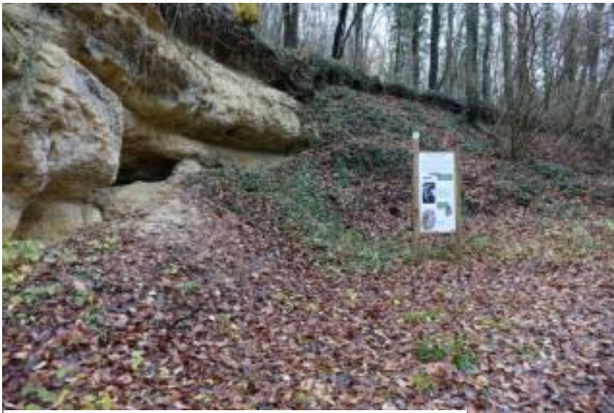
A proximité du panneau chauve-souris