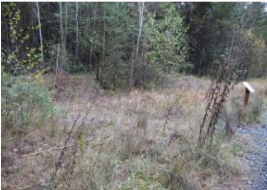
A proximité du panneau sur les zones humides