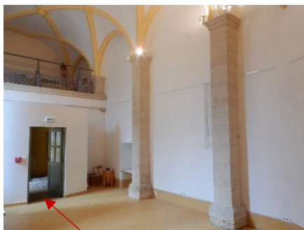
Entrée de la chapelle

Mise à disposition de lieux : un lieu de création (chapelle de la médiathèque (42 m 2 ) et ses extérieurs) avec accès internet, wifi, cuisine, et éventuellement un lieu d'exposition (salle d'exposition de la médiathèque) : Médiathèque d'Uzès, 41 le Portalet, 30700 Uzès.