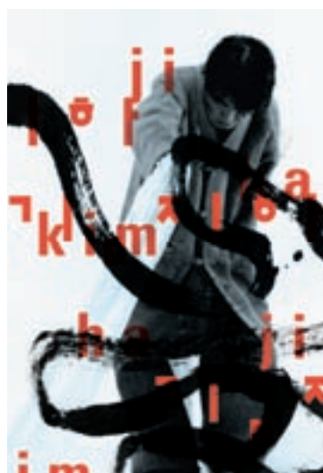
29 Norm, affiche, Centre culturel suisse, 2005 35