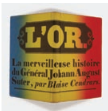
4 Bruno Monguzzi, affiche, Musée cantonal d'Art de Lugano, 1996