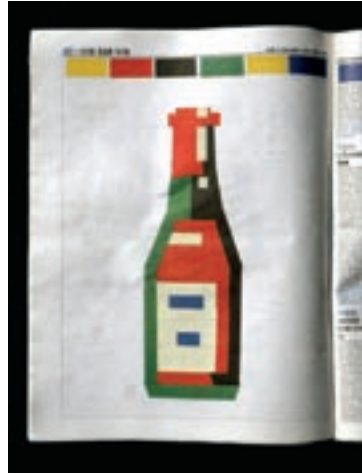
40 Fanette Mellier, affiche, Biennale de la jeune création, 2006 42 Change Is Good, illustration, guide du Fooding, Libération , 2005