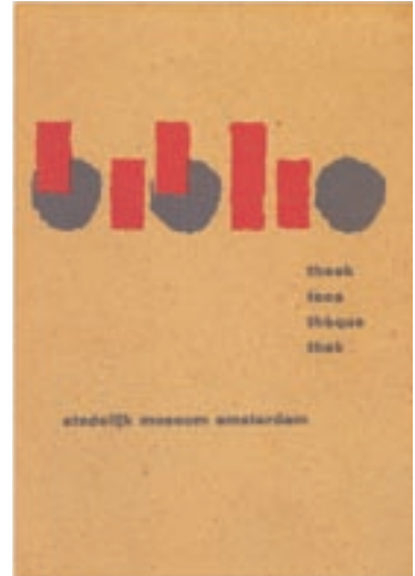
46 Ich&Kar, identité graphique, hôtel CONDESA df, 2006 54 Willem Sandberg, couverture de livre, bibliothèque du Stedelijk Museum, 1957