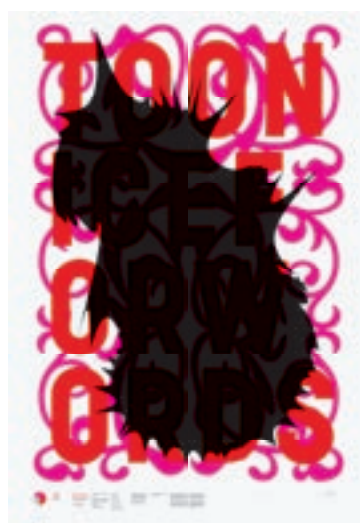
18 Wim Crowel, affiche, Stedelijk Museum, 1957