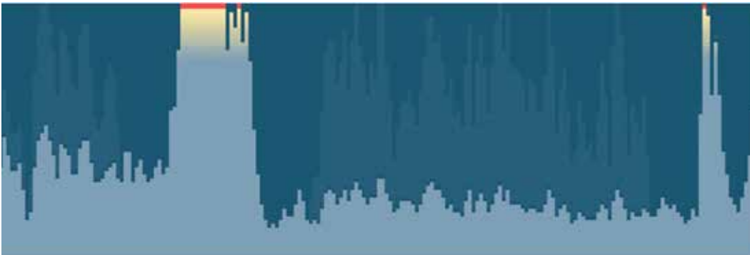
Marche enregistrée autour du lac Ha!Ha, projet sonore à AVATAR