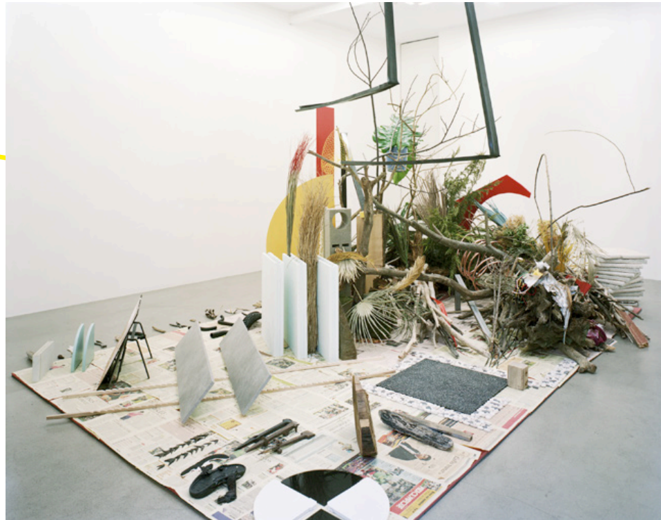
CAMILLE HENROT ROBINSON CRUSOE - DANIEL DEFOE - 2012 FNAC 2014, 005. Centre national des arts plastiques.

Le parrainage se définit « comme un soutien matériel apporté à une manifestation, à une personne, à un produit ou à une organisation en vue d'en retirer un bénéfice direct » (arrêté du 6 janvier 1989 relatif à la terminologie économique et financière). L'article 39-1-7° du CGI prévoit que les dépenses engagées par les entreprises dans le cadre de manifestations notamment à caractère culturel ou concourant à la mise en valeur du patrimoine artistique ou à la diffusion de la culture, de la langue et des connaissances scientifiques françaises sont déductibles du revenu imposable de l'entreprise lorsqu'elles sont engagées dans l'intérêt direct de l'exploitation. Les dépenses engagées doivent satisfaire les conditions générales des charges au même titre que les autres frais généraux. En raison de son caractère commercial, la dépense de parrainage doit faire l'objet d'une facturation assujettie à la TVA.