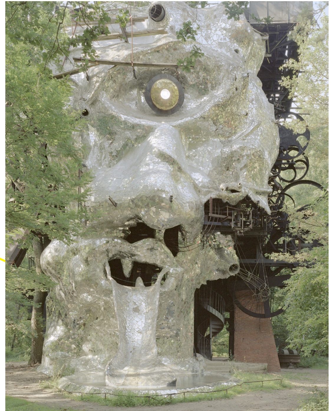
JEAN TINGUELY LE CYCLOP - 1969 - 1994 La face aux miroirs, FNAC 9541971, Centre national des arts plastiques.