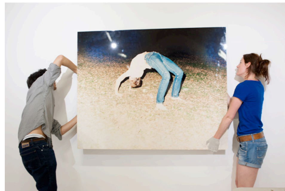
«IL N'Y A PAS DE MONDE ACHÉVÉ» DU 7 JUILLET AU 21 SEPTEMBRE 2014 Vue de l'accrochage, Galerie ARENA, Arles. © ENSP/CNAP / Photo : Emilie Saubestre.