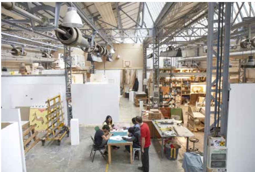
Vues de l'usine