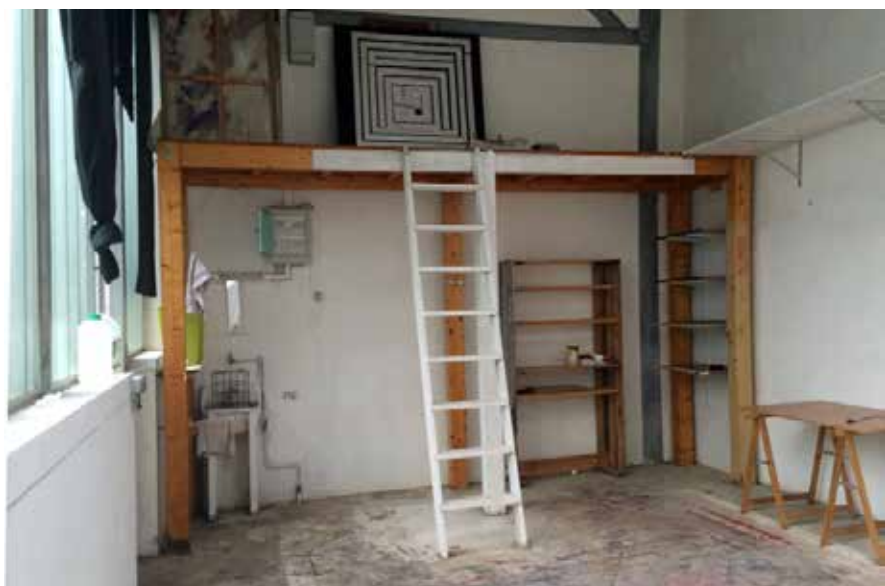
Vue d'un atelier type de l'allée